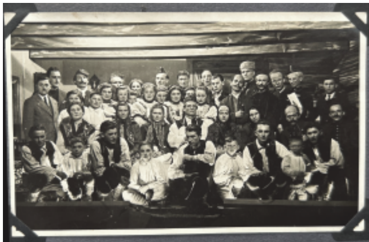
Herci představení Maryša