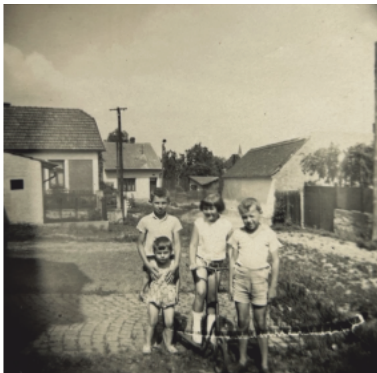
Fotka dětí pořízená na stále existujícím chodníčku před domem Kopáčkových (č. 32)