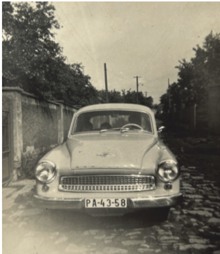
Automobil s posádkou na Drahách (mezi domy č. 25 a 31)

V minulém zpravodaji nezbylo místo na fotografie k povídání O zakřanské kovárně. Napravujeme to v tomto čísle a můžete si tak prohlédnout obrázky, ze kterých dýchá krása minulosti.