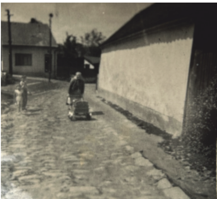
Na Drahách - vpravo dnešní dům č. 22, za nímž byla kovárna, v pozadí dům č. 113, který vypadá i dnes stejně.