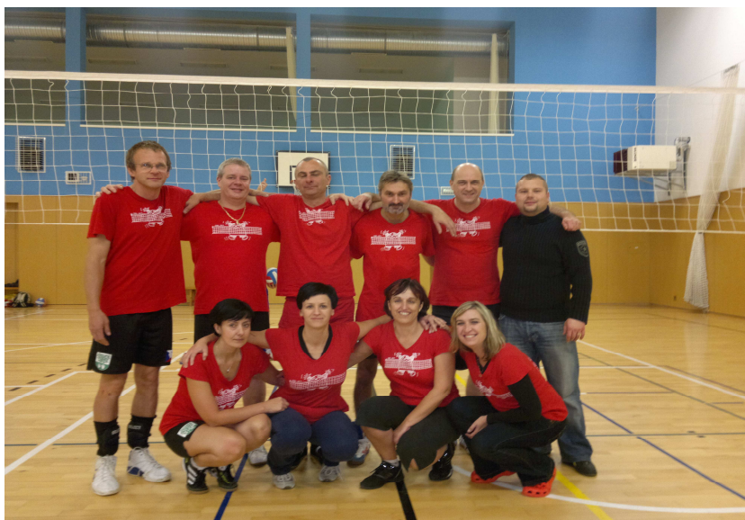
Naši volejbalisté se zúčastnili 17.11.2011 turnaje ve Střelčicích, na kterém úspěšně reprezentovali naši obec.

Zpravodaj Zakřan vydává Obecní úřad Zakřany Tisk: Pamiro team spol. s.r.o., Rosice