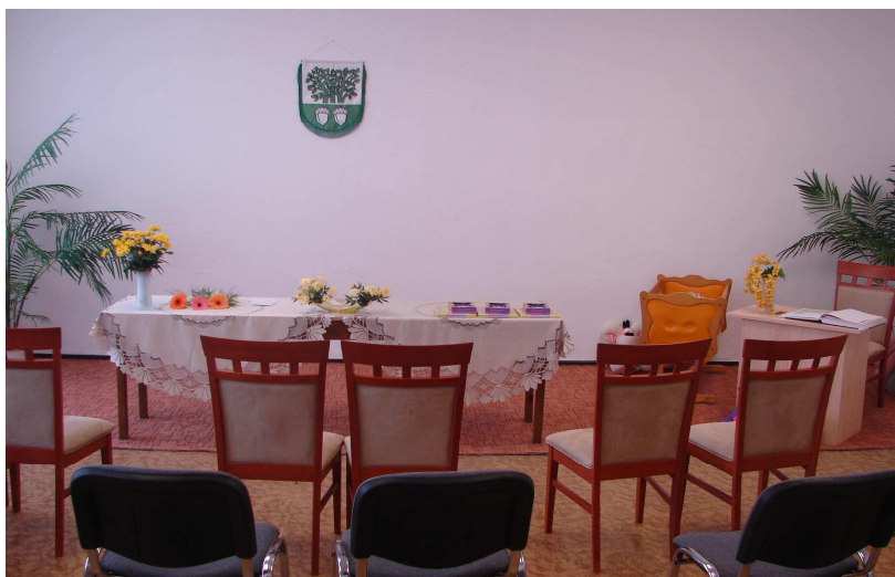
Nová obřadní síň v budově č. 92