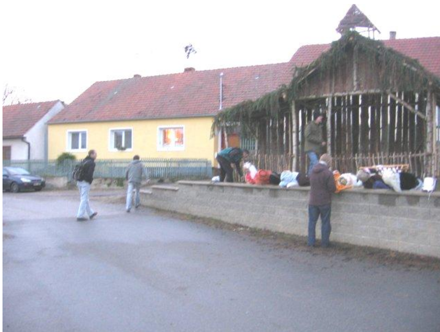
Nahoře: Stavba betlému (prosinec 2011) Dole: Rozsvícení vánočního stromku (prosinec 2012)