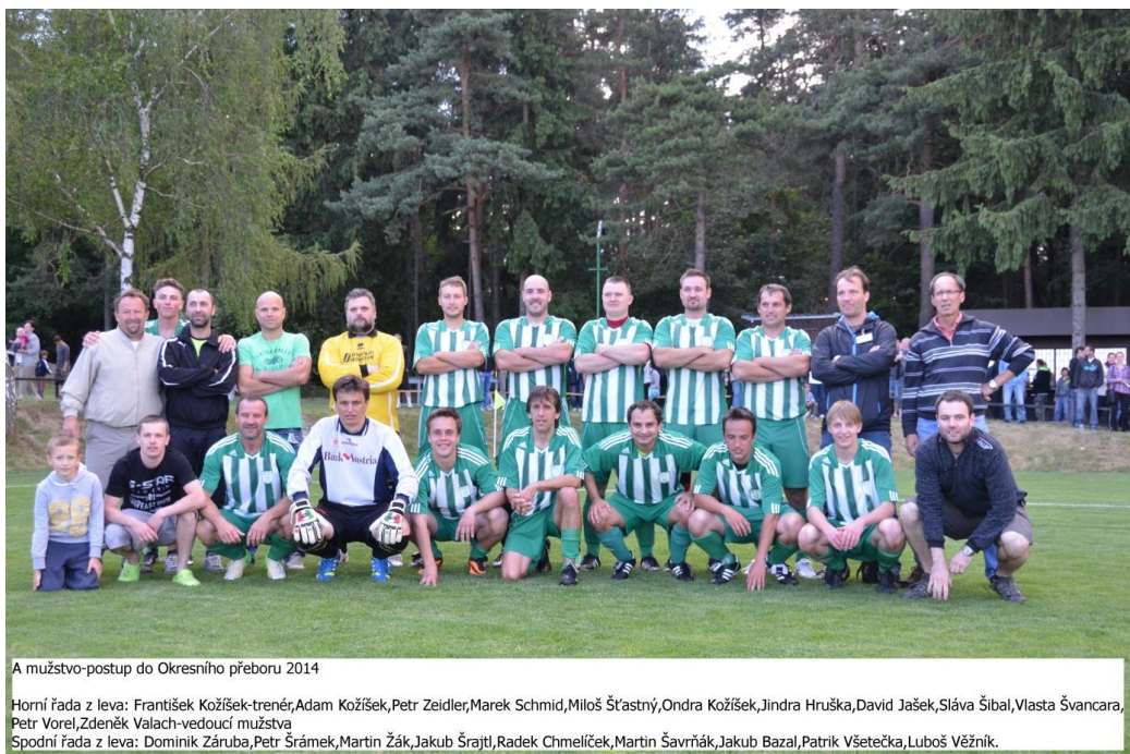
A mužstvo-postup do Okresního přeboru 2014