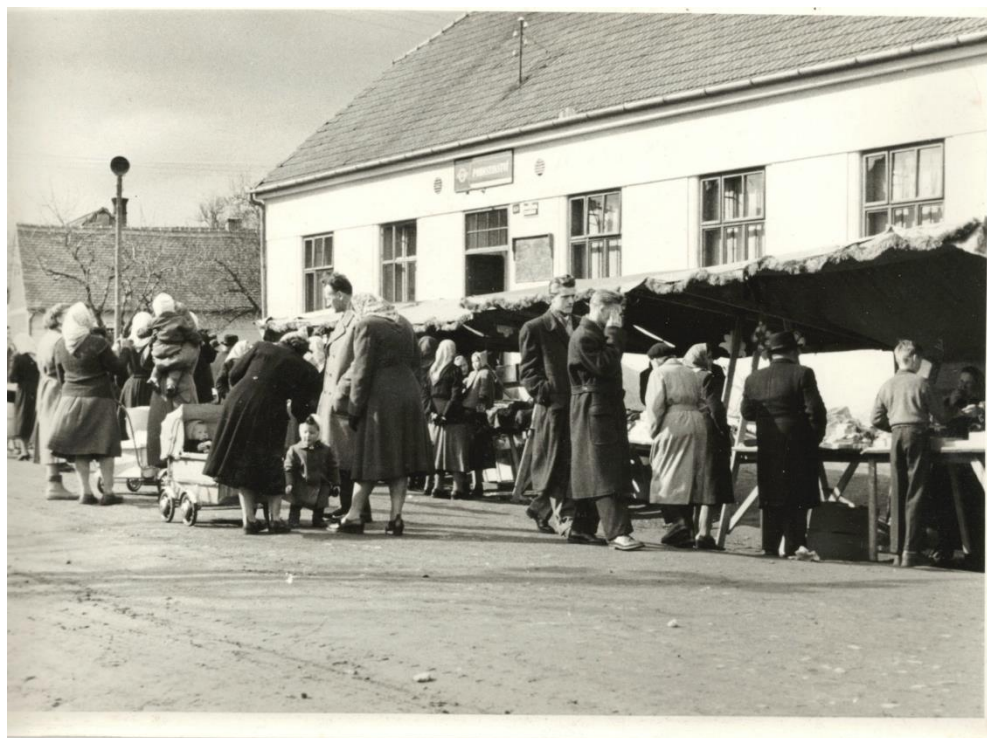
Pohled do minulosti