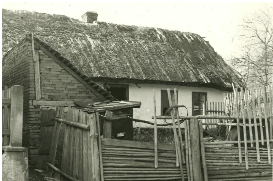
Fotografie Zakřanských chalup

Zpravodaj Zakřan vydává Obecní úřad Zakřany