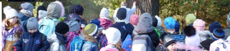
Žáci 5. ročníku ZŠ Zakřany