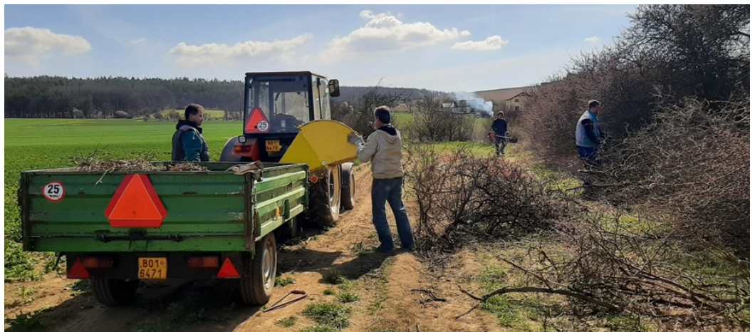
Úprava cesty od hřbitova