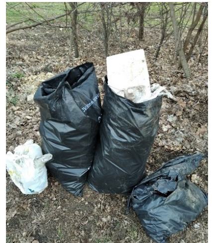
Uklid na Výseku